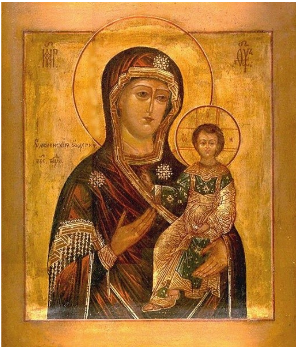
Die Hodegetria von Smolensk