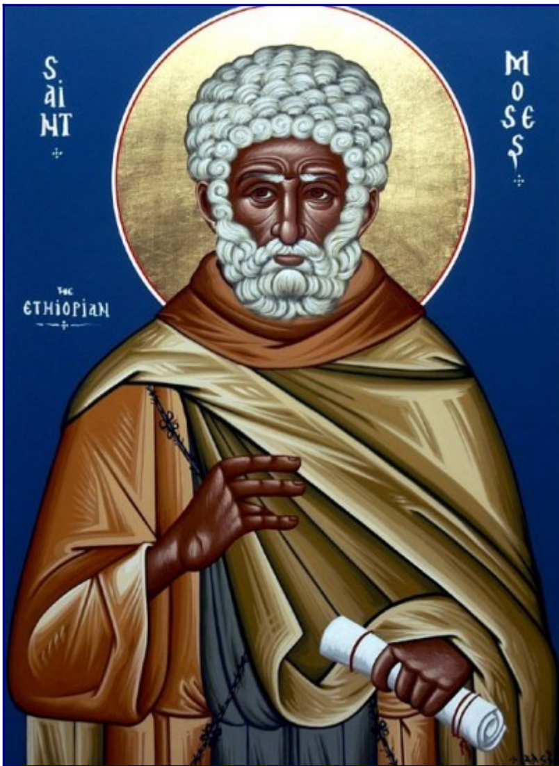
Ο άγιος Μωυσής ο Αιθίοπας

3) Με το χιούμορ στα έργα και στην αλληλογραφία των Τριών Ιεραρχών ασχολείται ο Κωνσταντίνος Νικολακόπουλος στα Ερμηνευτικά μελετήματα από ρητορικής και υμνολογικής απόψεως, Πουρναράς, Θεσσαλονίκη 2005, σελ. 231-254.