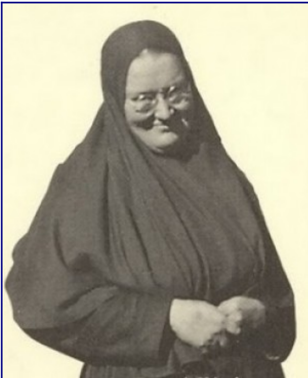
Το χαμόγελο της αγίας Μαρίας Σκόμπτσοβας

Από τις βιογραφίες σύγχρονων αγίων Γερόντων, όπως ο Παΐσιος , ο Πορφύριος , η Γερόντισσα Γαβριηλία κ.ά., ξέρουμε ότι γελούσαν και έκαναν χιούμορ. Επίσης, μια από τις πιο γνωστές φωτο του (γενικά μάλλον εσωστρεφούς) αγίου Γέροντα Σωφρόνιου του Essex είναι εκείνη που τον εμφανίζει να γελάει, και μάλιστα με ένα γέλιο εντελώς παιδικό (την είδες πιο πάνω)! Γελάει στη φωτογραφία της και η αγία Μαρία Σκόμπτσοβα, η ακτιβίστρια της Γαλλίας και Νεομάρτυρας (από τους Ναζί).