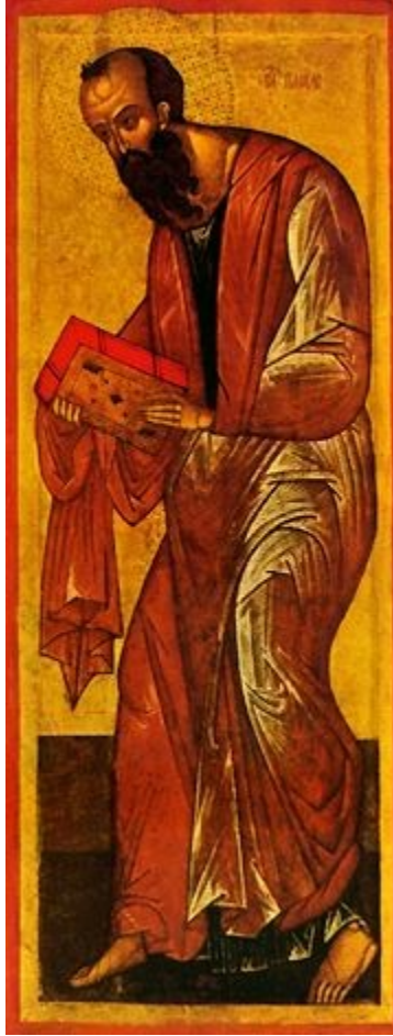
Ikone: der Hl. Apostel Paulus