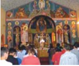
Τα τραγούδια των Χριστιανικών Μαθητικών Ομάδων