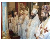
Szent István király ünnepe