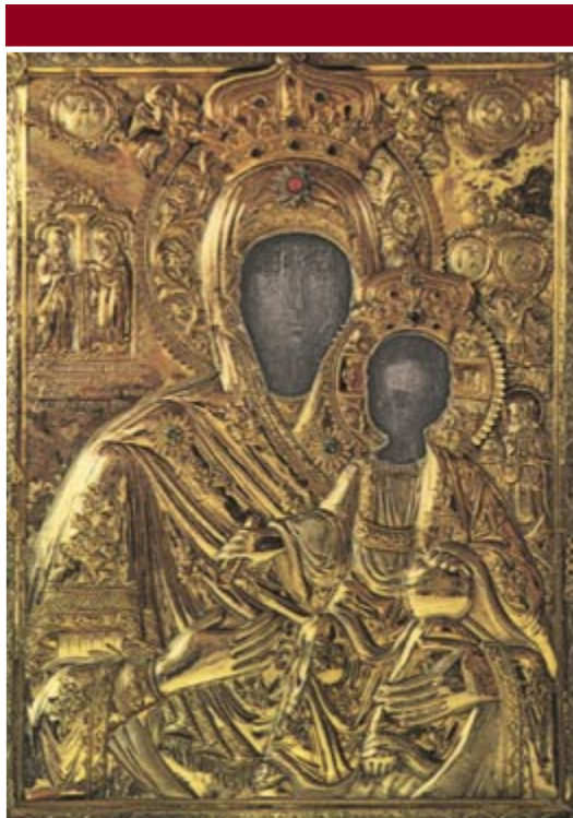
Το "Άξιον Εστί"

Το Α΄ τυπικό του Αγίου Όρους (971/2 μ.Χ.) καθορίστηκε από τις αποφάσεις του Ιωάννη Τσιμισκή και εξακολουθεί να ισχύει ακόμη και σήμερα ως ο βασικός νόμος που διέπει τα του Άθω. Σώζεται σε περγαμνή από αγνό δέρμα γι' αυτό λέγεται "Τράγος". Σήμερα διατηρείται σε κιβώτιο σφραγισμένο με βουλοκέρι,