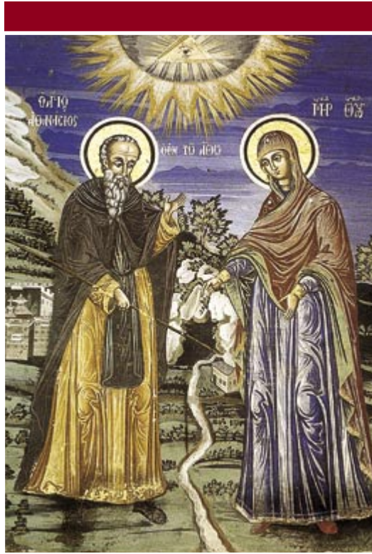
Το θαύμα του Αγιάσματος (19ος αιώνας) (Τοιχογραφία Νάρθηκος Ι. Μ. Λαύρας)

«Καθολικό» ή «καθολικός ναός», ονομάζεται ο κεντρικός ναός των μοναστηριών. Βρίσκεται στην πιο τιμητική θέση, ελεύθερος από παντού, συνήθως στην μέση της αυλής. Σχεδόν όλα τα καθολικά του Αγίου Όρους ακολουθούν ένα ιδιαίτερο αρχιτεκτονικό τύπο που καλείται «αγιορείτικος» και που βασικά ανάγεται στο σύνθετο τετρακίονιο με τρούηλο ναό της σχολής