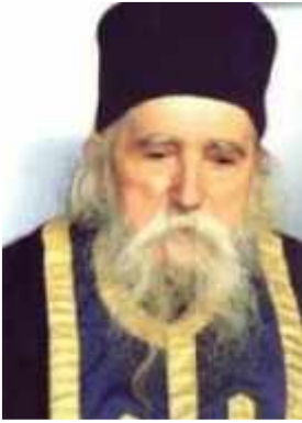
Ο γνωστός Ρουμάνος ασκητής π. Ηλίας Κλεόπα