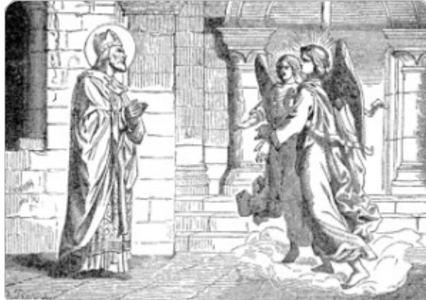
Άγιοι της Γαλατίας

Η μνήμη της τιμάται στις 2 Απριλίου 2017