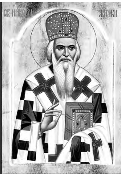
ΑΓΙΟΥ ΝΙΚΟΛΑΟΥ ΒΕΛΙΜΙΡΟΒΙΤΣ ΕΠΙΣΚΟΠΟΥ ΑΧΡΙΔΟΣ, † 1956