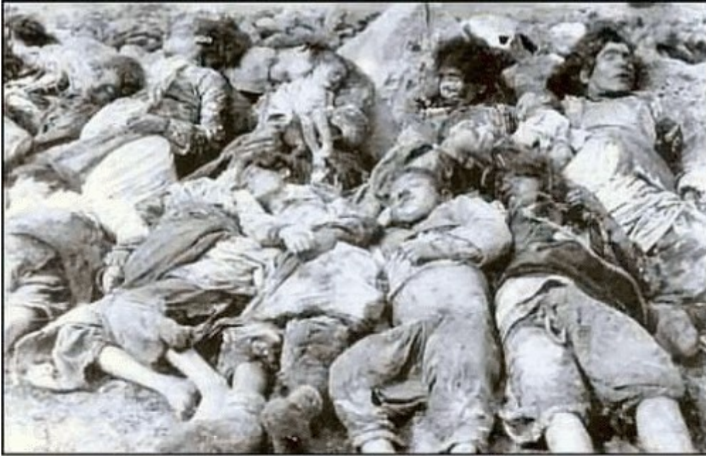
Armenian & Greek Genocide by Turkish Muslims against Christians

Qur'an:8:39 "Wage war on non-muslims and kill them until they submit and the only religion is Islam."