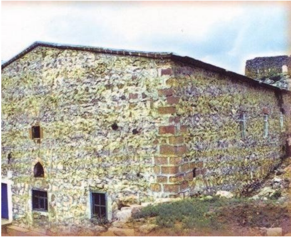
Ιερός Ναός Οσιομαρτύρων Βαραχισίου και Ιωνά όπου λειτουργούσε ο Όσιος Αρσένιος ο Καππαδόκης